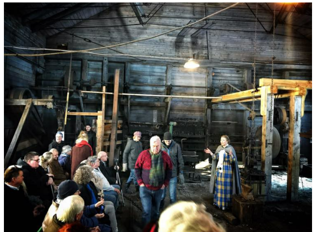
Olofsfors Bruksmuseum. Foto: Caroline Kvick