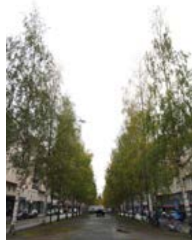
Umeå - Björkarnas stad