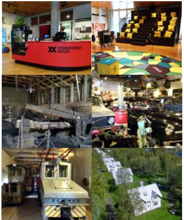
Från övre till vänster: 1 Väven. 2 Interiör Kvinnohistoriskt museum. 3. Olofsfors Bruksmuseum. 4 Vännäs motormuseum. 5 Robertsfors Bruksmuseum m bruksjärnväg. 6 Norrbyskärs museum.