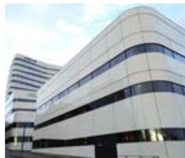
Väven - Hotell U&me, Kvinnohistoriskt museum samt restaurang fredag lunch och kväll.