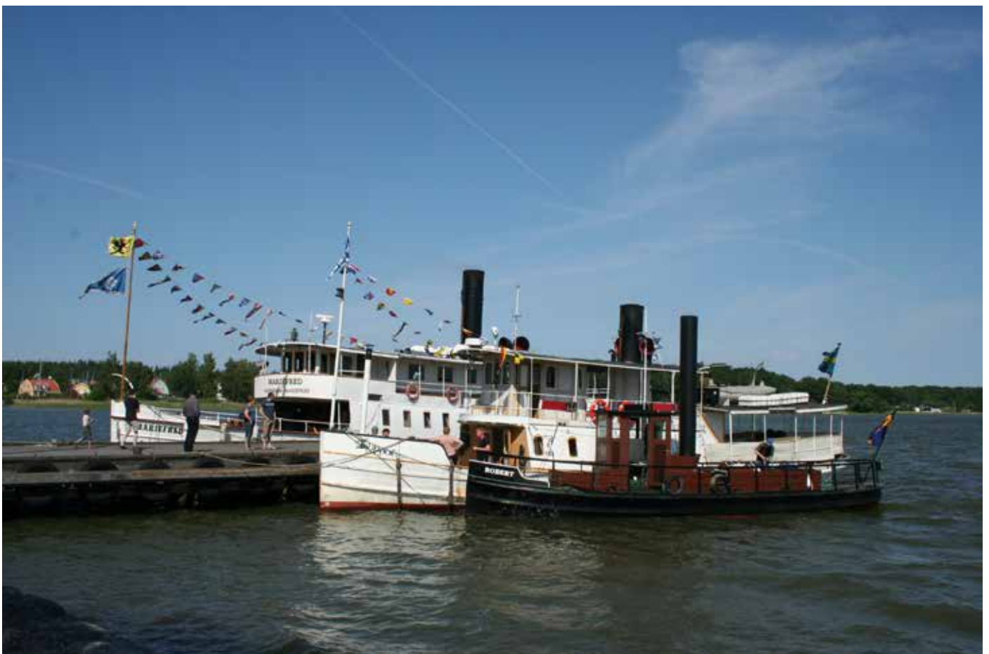
Ångarna Ejdern, Mariefred och Robert förtöjda vid bryggan i Mariefred.