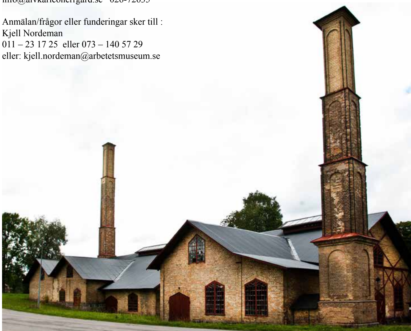
Karlholmsbruk.