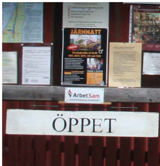
En emaljskylt på plats i Blekinge.

Många fattas oss idag. De är människor som är