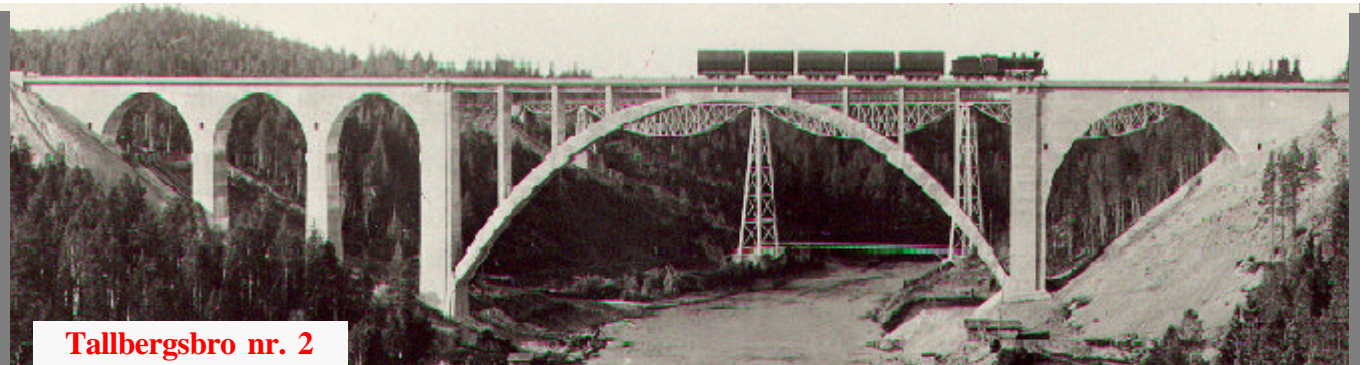
Tallbergsbro nr. 2