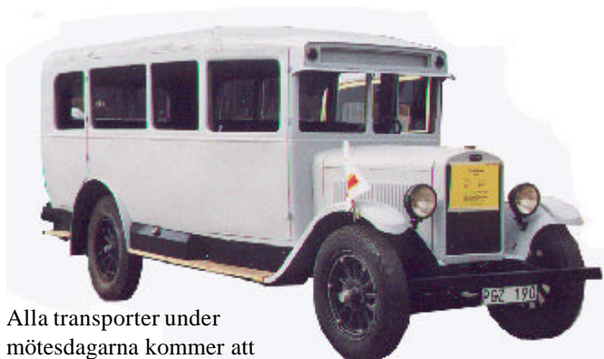
Alla transporter under mötesdagarna kommer att ombesörjas av Primus motor och bussarna blir förståss av märket Hägglunds och söner. Hägglundsbus 1930.

Motor: Hirth 500/105 hkr. Toppfart 210 km/tim. Operativ höjd: 5000 meter. Spännvidd 10,6 m. Flygvapentjänst 1945-52. Totalt 125 st. varav 95 såldes till Danmark 1954.