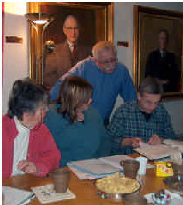
Den första arkivutbildningen genomfördes på Rönnskär i Västerbotten.

Hösten 2005 tog ArbetSam fram en skylt som våra medlemmar kan beställa för att visa att de är med i