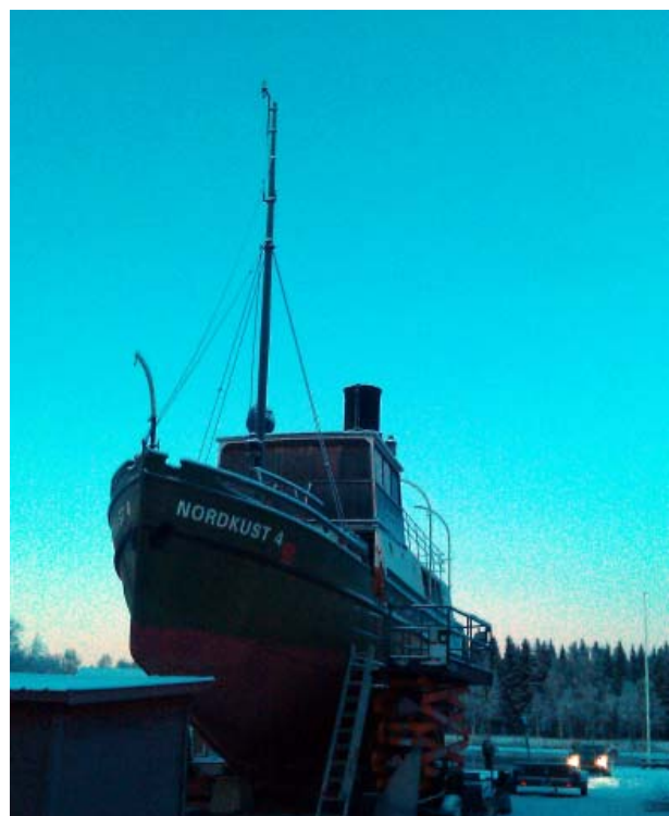
Ophelia på slip i Stackgrönnan, -12 grader.

Ophelia beställdes till Galtströms bruk och återvänder nu till bruksområdet. Fartyget övertas av föreningen Galtströmståget. Man beräknar att restaureringsprojektet kommer att ta cirka 12 år. Då skall fartyget segla för egen maskin.