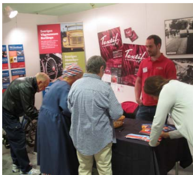
I Sveriges vägmuseums monter fick besökarna gissa på vad det var för föremål som var utställt.

Hur skall vi jobba med pedagogiken på arbetslivsmuseer, tidsresor och goda pedagogiska exempel.