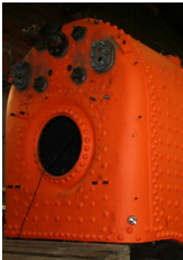
Ångpanna under renovering, Lennakatten i Uppsala.