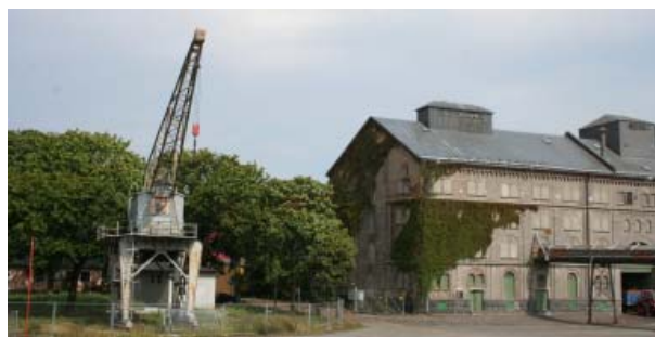
Kulturarvslyft. Hamnkranen i Norrköping

Kulturarvslyftet inleds i januari 2012 och man beräknar att 1 200 personer skall beredas plats under det första året.