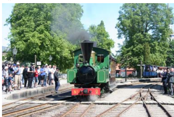
Östra Södermanlands Järnväg