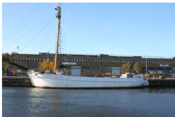
Tremastskonaren Ingo, under mastbyte i Göteborgs hamn