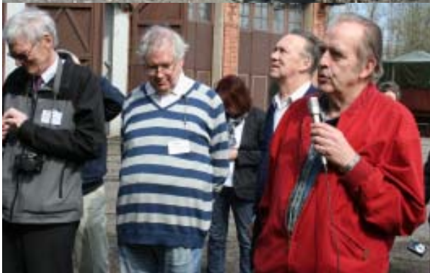
Grängesbergs station, utanför Nostalgimuseet & Grängesbergsbanornas järnvägmuseum.