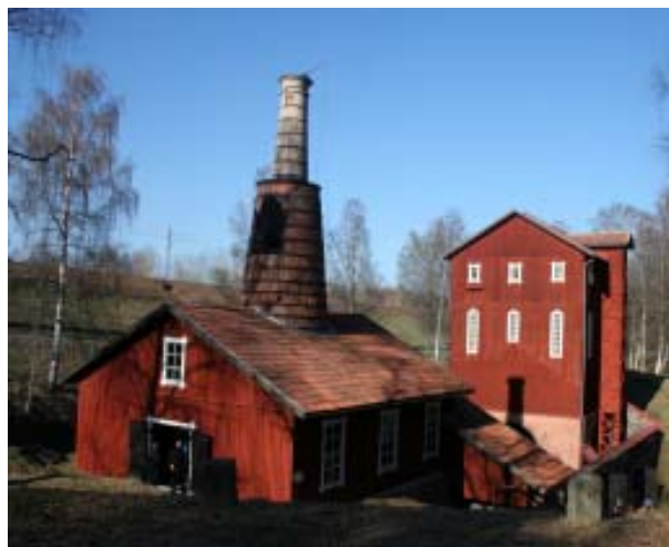
Klenshyttan.