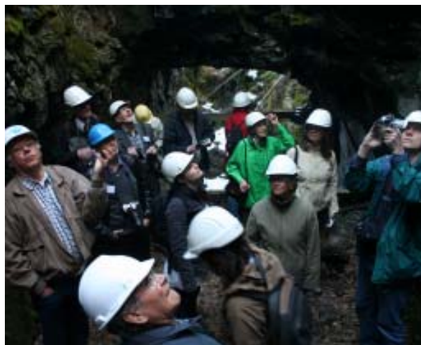
Nere i Flogbergets inre.