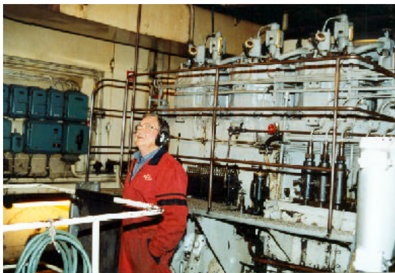
Maskinist ombord på Kalmarsund VIII, den stora NOHAB-dieseln i bakgrunden.