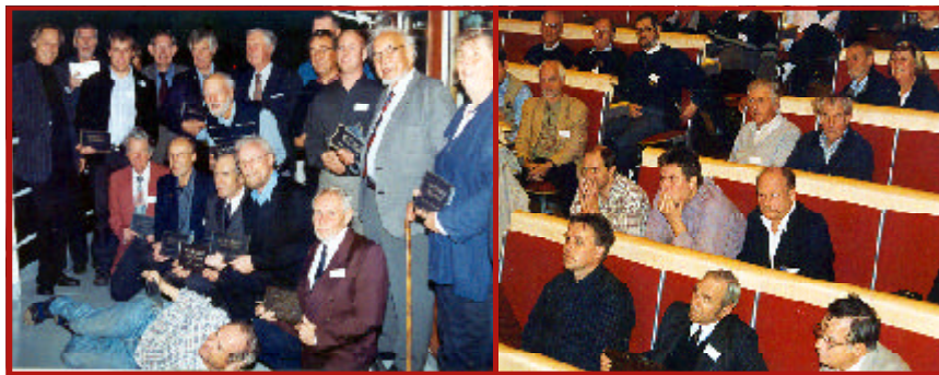
På kvällen delades K-märkningsplaketter ut till ett stort antal fartyg.

Kjell betonade det viktigt i att båtarna skall brukas, att de får gå sönder och att man sedan kan laga dem.