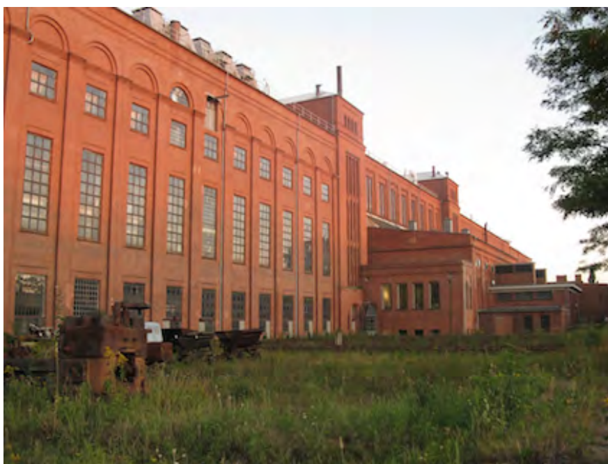
Energifabrik Knappenrode drygt 60 km öster om Leipzig. Denna stora fabrik för tillverkning av briketter av brunkol invigdes 1918 och var i drift till 1993.

Det var naturligtvis omöjligt att ta in allt som presenterades och vi var nog många som upplevde en viss frustration över att behöva väja mellan intressanta parallella aktiviteter. En reflektion kring det som presenterades under veckan var att synen på industrihistoria och industriminnesvård kanske inte alltid är helt konsistent, inte i ett regionalt/nationellt perspektiv och i synnerhet inte vid en global utblick. Detta kanske också är en generationsfråga.