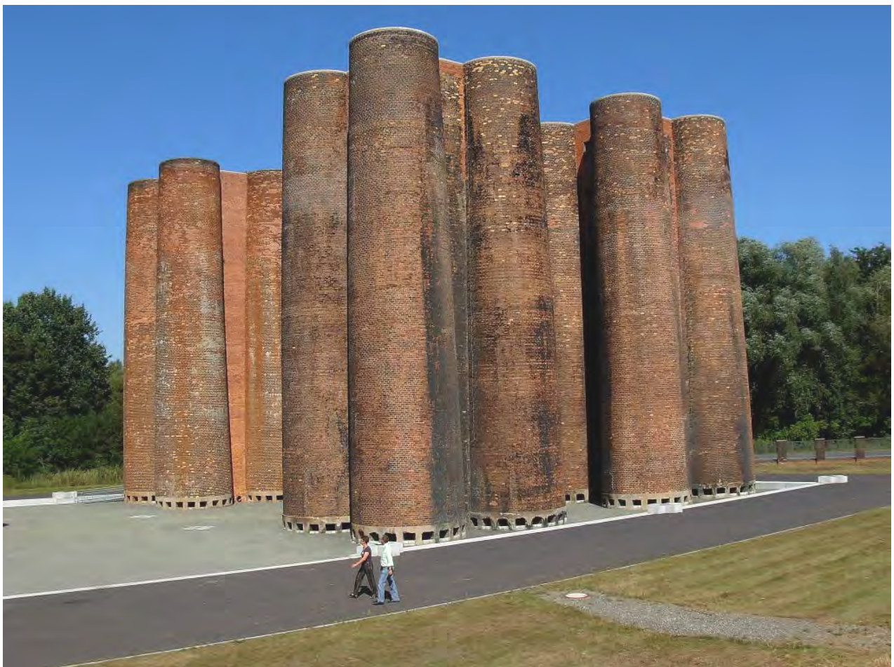
Medeltida borg? Nej, de bevarade resterna efter en anläggning för att rena spillvatten från koksverket i Lauchhammer. Anläggningen var i drift 1952-91 och är i övrigt i stort sett jämnad med marken.

När det gäller plenarföreläsningarna var bidraget av Hans Grube med titeln ”The economical Renaissance of the Industrial Heritage” spännande, med en diskussion av industrial heritage från näringslivets horisont på ett sätt som sällan görs i samband med olika TICCIH-möten.