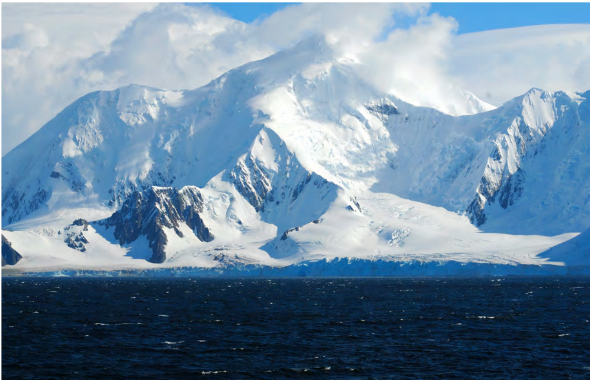
Livingstone Island, South Shetland öarna i Antarktis - bas för säl fångstindustrin i området på 1800-talet.

Scale International Exploitation of Polar Areas). LASHIPA är ett internationellt historisk-arkeologiskt forskningsprojekt