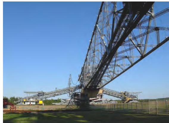
Besöksgruva med den gigantiska apparaten F60, ett enormt mekano för att flytta jordmassor.