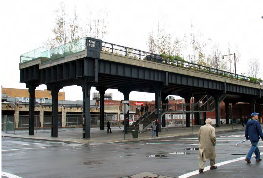
The High Line på Manhattan.

men banan öppnades upp igen i juni 2009, nu omskapad till ett välbesökt promenadstråk, en offentlig plats och en blomstrandestadspark. Efternedläggningen av tågtrafikens nedläggning fram till idag började vildgräs, blommor och träd skjuta skott mellan syllar och räls, räls som idag används som avskärmare i blomsterbäddar medan odlingar och träd numera sköts av en grupp trädgårdsmästare från föreningen Friends of The High Line.