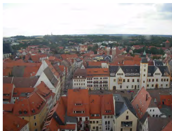
Överblick över Freiberg.