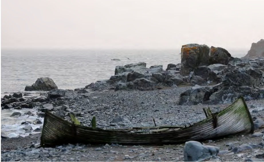
En av de många lämningarna efter valfångstindustrin på Antarktis, Half Moon Island, Antarktis.

inom ramen för det Internationella Polaråret (IPY 2007-2009, se www.ipy.se samt www.lashipa.nl ). Dess övergripande syfte är att förklara utvecklingen av industri i polartrakterna från 1600-talet till idag, liksom konsekvenserna av denna industri för den geopolitiska situationen i Arktis och Antarktis liksom för den lokala miljön.