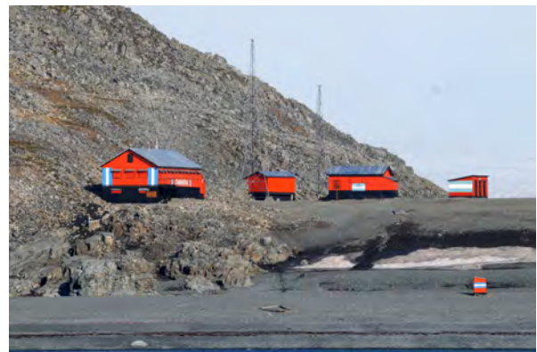
Argentinsk forskningsstation, Half moon island - en geo-politisk markör i ett omstritt område.

Expeditionen seglar från Port Stanley på Falklandsöarna / Malvinas 6 mars 2010, över Drakes passage till den Antarktiska ögruppen South Orkney. Där kommer expeditionsdeltagarna att dokumentera lämningarna av en valfångststation på Signy Island och en forskningsstation på Lauri Island. Därefter går expeditionen vidare mot South Shetland öarna och Antarktiska halvön, där den skall dokumentera lämningar av valfångst och av forskningsstationer. Expeditionen seglar sedan åter till Port Stanley, dit den förväntas anlända den tredje april.