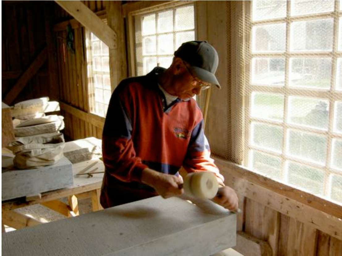
Med klubba och mejsel ger stenhuggaren den hyvlade trappstenen dess slutliga yta.