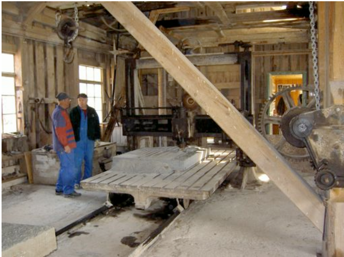
Bland stenhuggeriets många maskiner märks denna stenhyvel tillverkad år 1889.